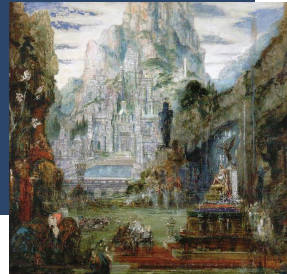
Le Triomphe d'Alexandre, Gustave Moreau, vers 1875-1890, huile sur toile, 155 x 155 cm.