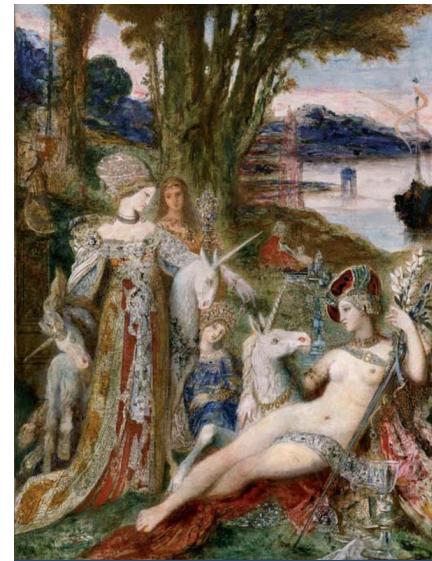
Les Licornes, Gustave Moreau, date inconnue, huile sur toile, 115 x 90 cm.

Le Musée Gustave Moreau est à Paris, il a la particularité d'avoir été pensé par l'artiste et d'être son ancien appartement. Des milliers de dessins, de peintures et d'aquarelles y sont exposés, il a notamment représenté des figures religieuses, historiques et mythologiques.