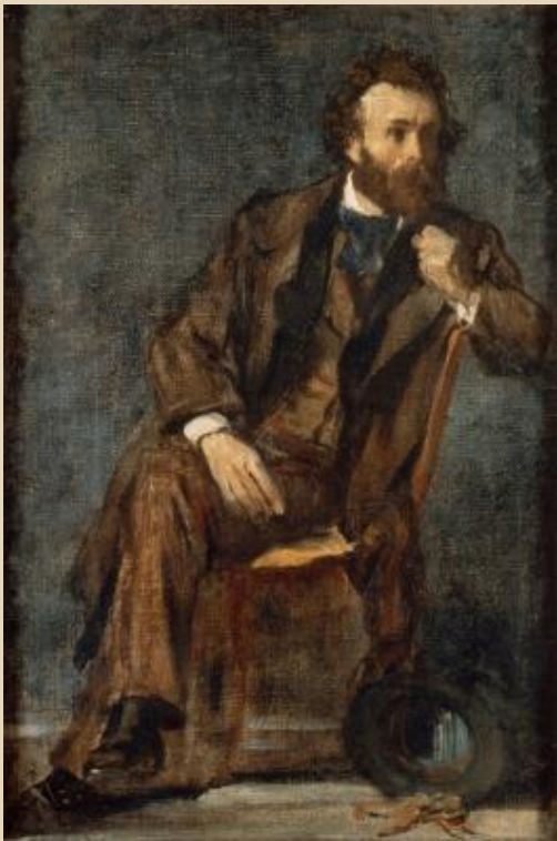
Portrait de Gustave Moreau , vers 1860 Edgar Degas Huile sur toile 40x27cm Musée Gustave Moreau