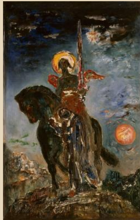
La Parque et l'Ange de la Mort , non daté, Gustave Moreau Huile sur toile 110x67cm Musée Gustave Moreau