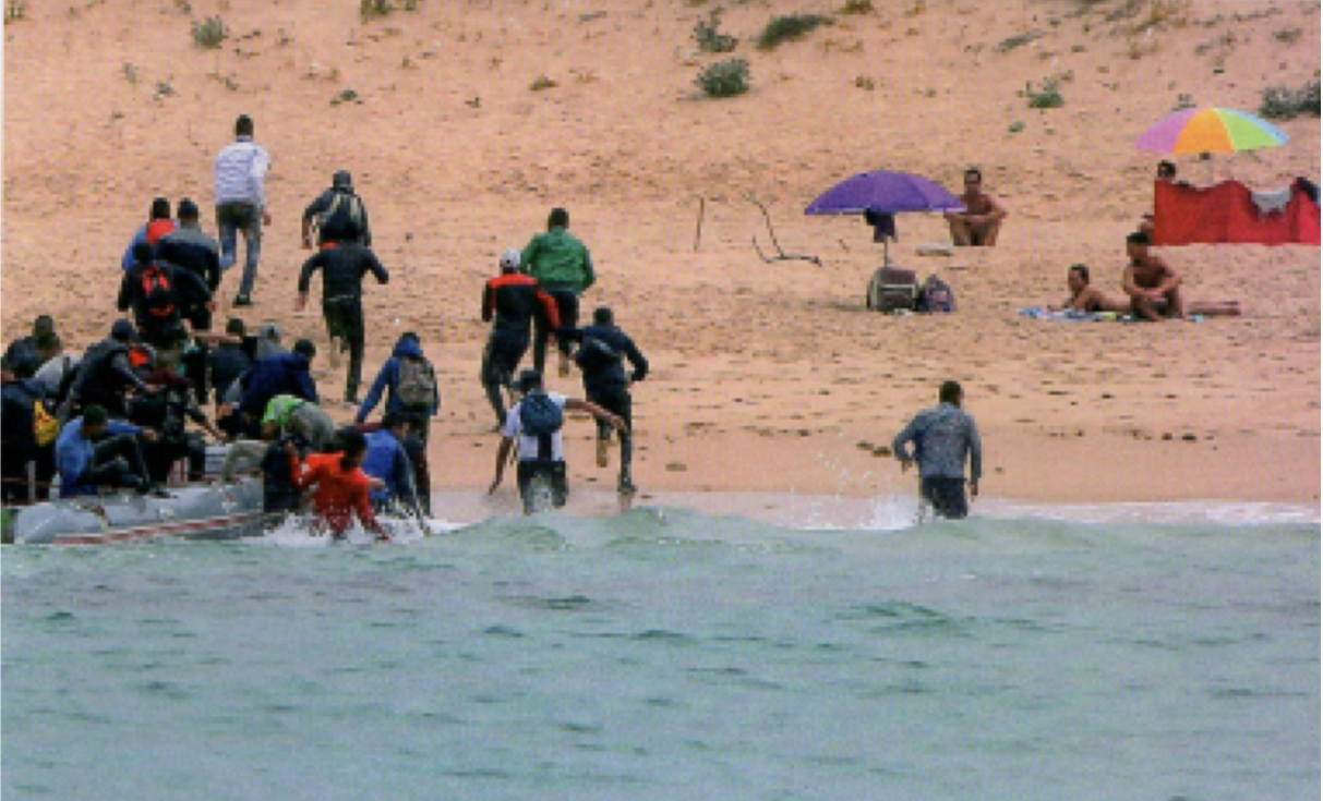
Migrants provenant du Maroc débarquant sur une plage du sud de l'Espagne (27 juillet 2018)