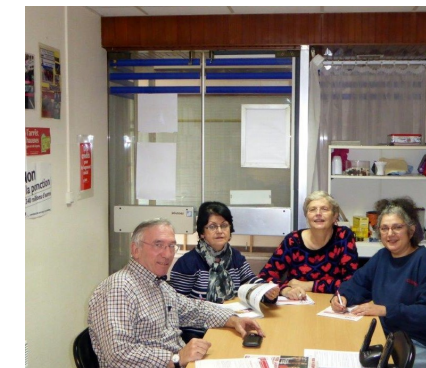
Une équipe dynamique aux permanences de la CNL Nanterre

Travaux. Comme demandée l'an dernier, l'isolation dans certains sous-sols a commencé. Pour lutter contre l'humidité l'office a isolé les murs de certains appartements. Mais les travaux sur les corniches de l'allée Politzer ne se feront pas. Insécurité. A Joliot Curie I, les locataires font état de squats, d'insécurité et de saleté (pourtant le ménage est fait correctement) dans les halls et les escaliers. C'est très difficile à vivre au quotidien. Conflit de voisinage. Ce n'est pas le rôle de l'office de trancher entre les conflits. Il est conseillé de s'adresser au Médiateur de justice. Ascenseurs en panne. Il est inadmissible qu'OTIS ne donne pas de délais de réparation. Parking. Il est proposé de renforcer la signalétique. Réhabilitation. Selon un document fourni par l'office, le montant du loyer de base serait augmenté de 45,29 %. C'est inadmissible d'autant plus certains travaux devraient être réalisés dans le cadre des grands travaux annuels sans augmentation.