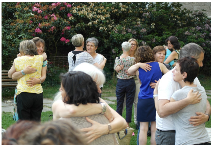
Séance de Free Hugs lors de la soirée de Juin

☞ Soirée du 06 Octobre 2016 - AFPA Rennes Les différentes facettes de l'Entrepreneuriat