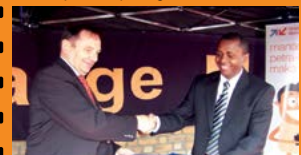
Du mobile money au mobile banking : une nouvelle innovation Orange Money Page 8