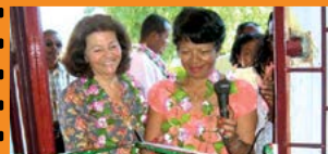
Deux nouveaux points Internet dans les CLIC de Marovoay et Anivorano Page 6