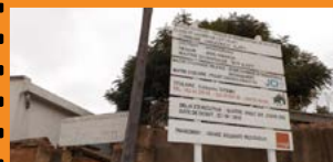
JCIM et Orange Solidarité Madagascar : démarrage de 2 projets éducatifs Page 3