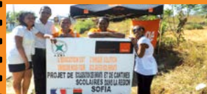
Région Sofia : 4 districts dotés de cantines scolaires Page 2