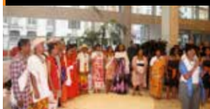
Chorale Orange Madagascar