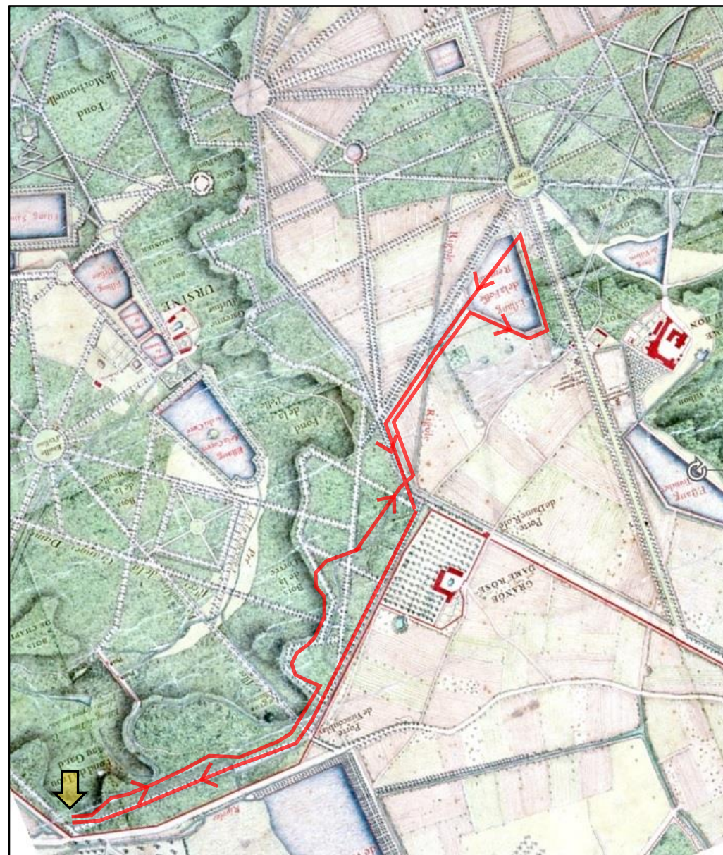
CARTE ALEXANDRE LEMOINE 1723