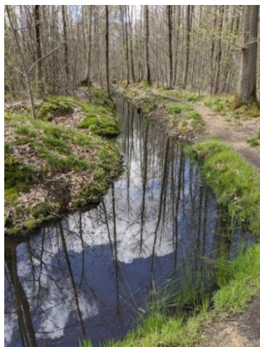
Rigole du Clos Laperrière à Vélizy.