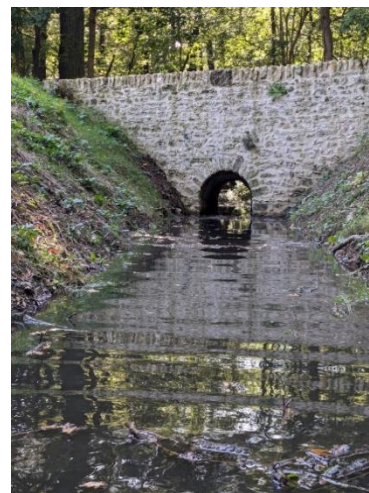
Rigole en eau sous le pont restauré de la Mare aux Faisans à Meudon.