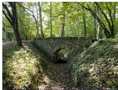
Rigole et le pont restauré de la Fosse Renault à Meudon.

Nouvel ouvrage de 96 pages, 412 illustrations, rédigé pour les 20 ans d'ARHYME et vendu 18 €.