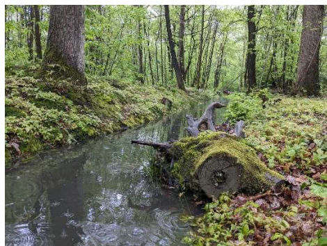
Rigole du Clos Laperrière à Vélizy.