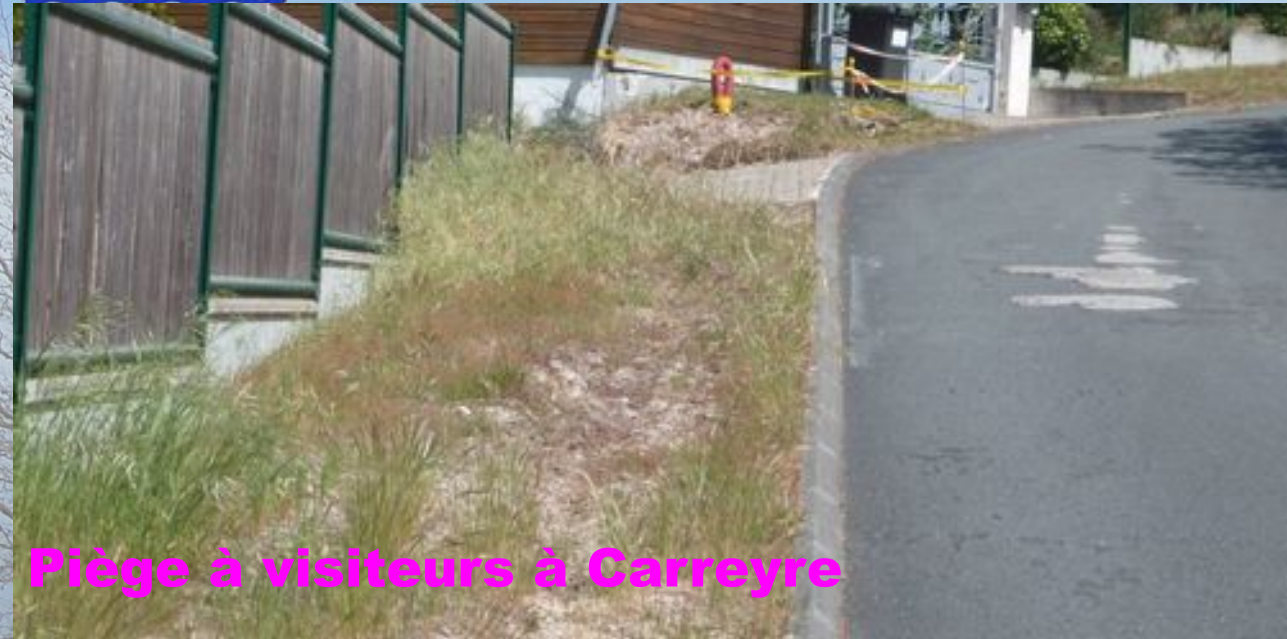
Piège à visiteurs à Carreyre