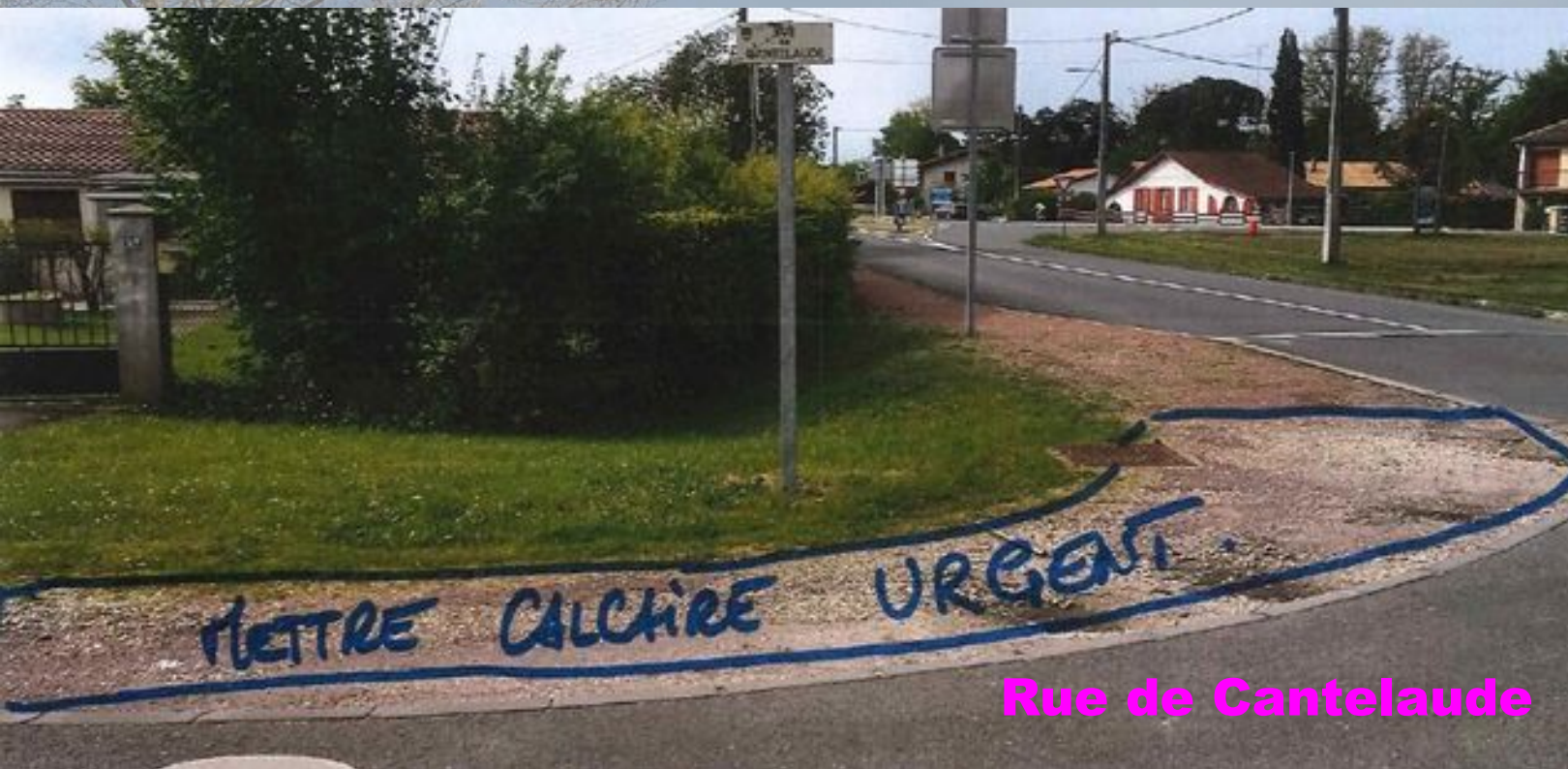
Rue de Cantelaude