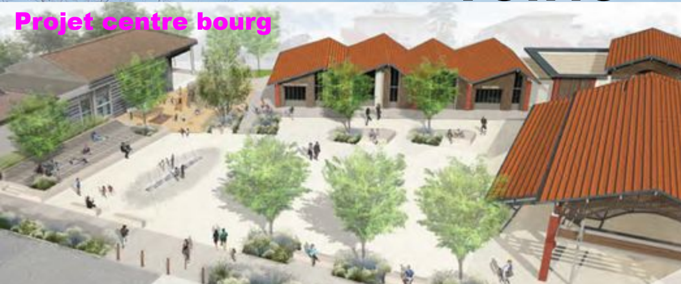
Projet centre bourg

Le centre bourg va être rénové entre la Gaité et l'église, quelques une de nos revendications de l'an passé ont été satisfaites, mais il reste beaucoup à faire dans les divers quartiers qui se sentent parfois oubliés