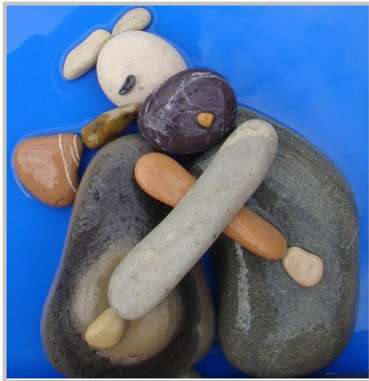
sculpture de Nizar Ali Badr