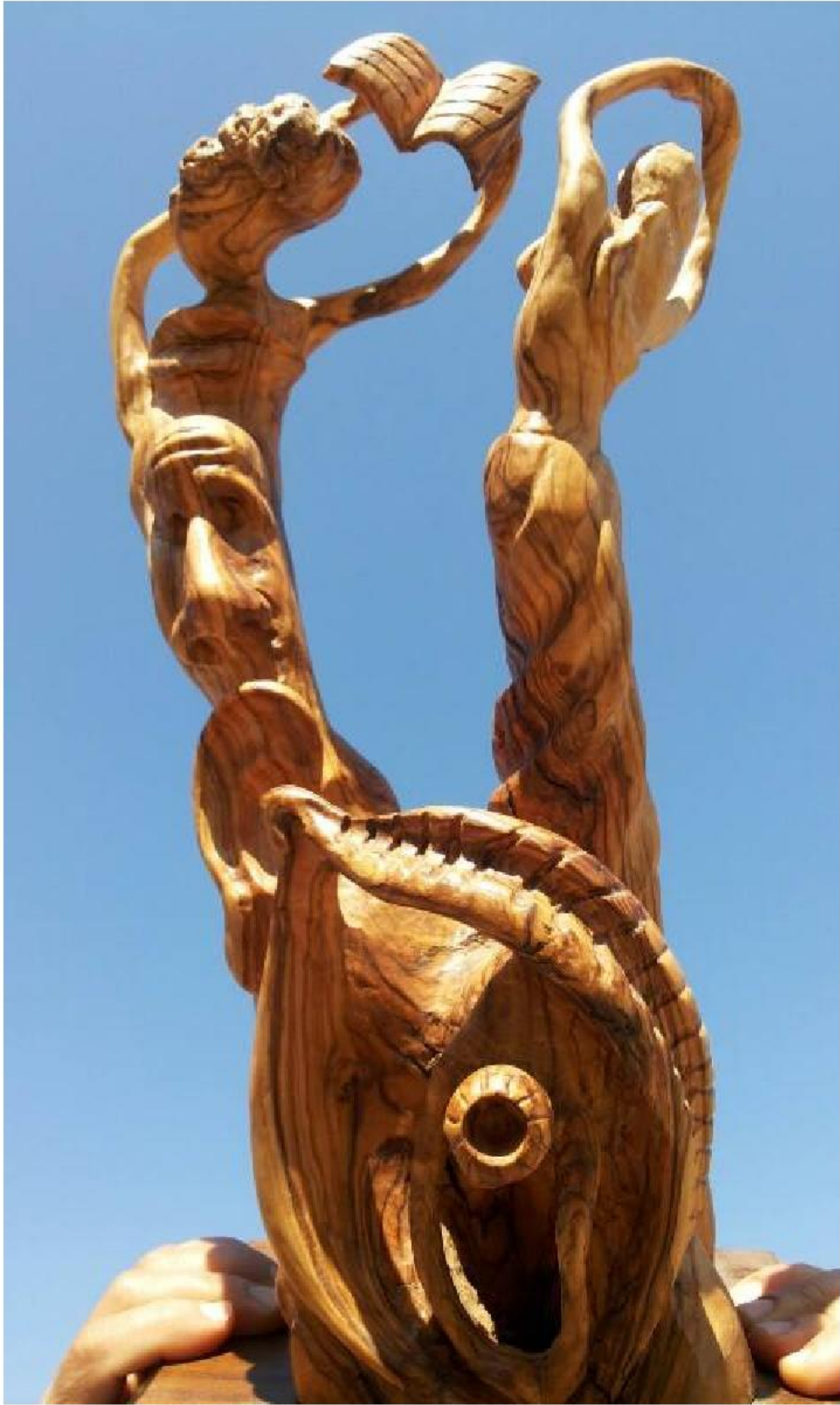
sculpture de Ali Bahaa Moualla (Syrie)