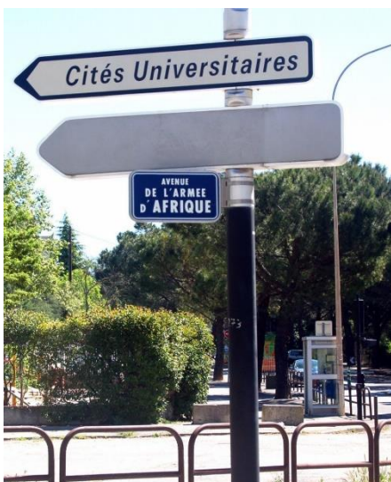
L'avenue de l'Armée d'Afrique à Aix en Provence

" Comme tous les hommes nés dans ce pays qui, un par un, essayaient d'apprendre à vivre sans racines et sans foi et qui tous ensemble aujourd'hui où ils risquaient l'anonymat définitif et la perte des seules traces sacrées de leur passage sur cette terre (...)devaient apprendre à naître aux autres, à l'immense cohue des conquérants maintenant évincés qui les avaient précédés sur cette terre et dont ils devaient reconnaître maintenant la fraternité de race et de destin. "