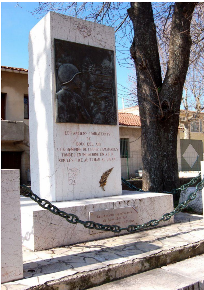
Le monument Outre Mer à Bouc Bel