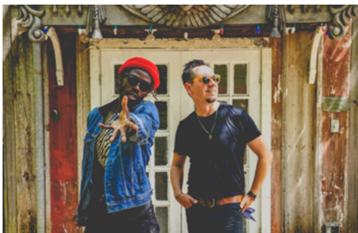
Groupe Black Pumas