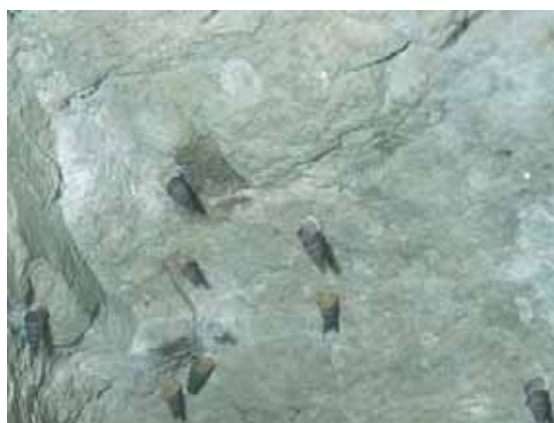
Les cochlostomes se rassemblent parfois en nombre sur les rochers calcaires.