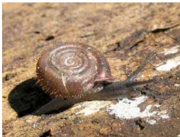
Remarquer les poils sur la coquille