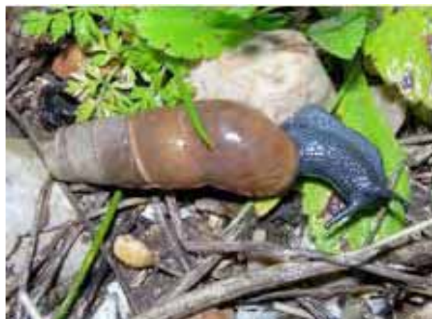
Coquille d'adulte à gauche, de jeune à droite.