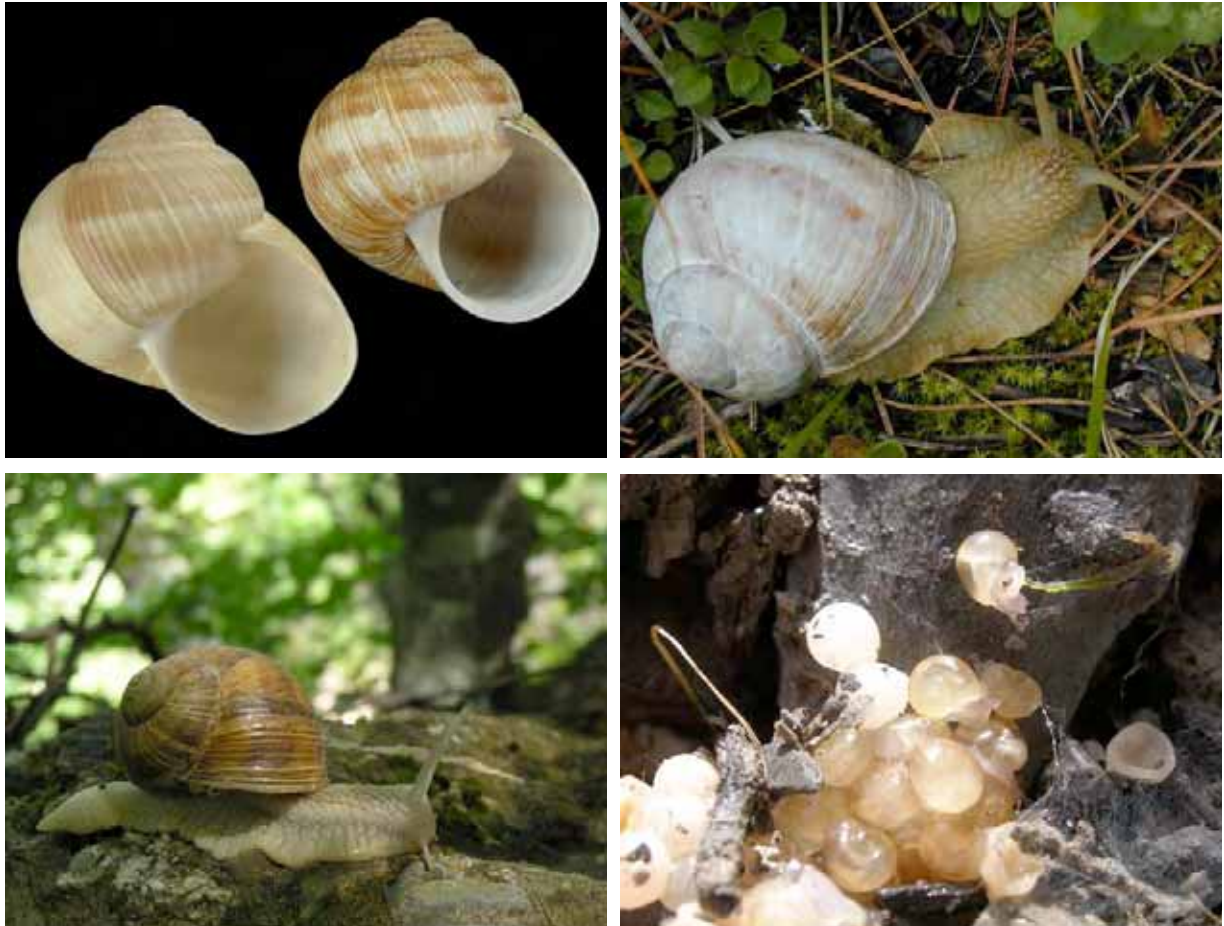
Ponte d'escargot de Bourgogne

Identification : Très grande coquille globuleuse, épaisse, ocre à blanc crème avec des stries d'accroissements. Coquille unie ou avec des bandes spirales très large, parfois indistinctes. Ouverture plus ronde que celle du petit-gris. Dans les bois, les haies, les prairies.