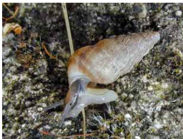
Remarquer l'opercule sur l'arrière du pied et les yeux à la base des tentacules.