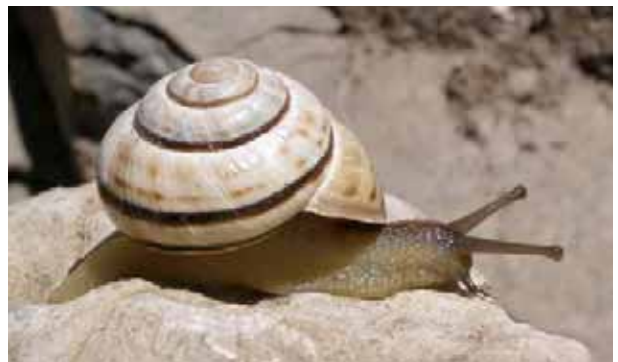
Escargot des forêts