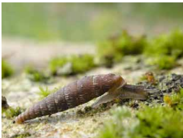
Les lieux moussus et humides sont recherchés par certaines espèces de clausilies, ici la clausilie allongée ( Clausilia bidentata crenulata ).