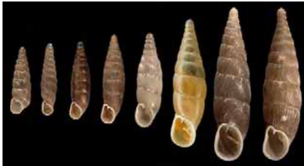
Quelques-unes des 47 clausilies présentes en France. Remarquer la forme caractéristique de la coquille.

Identification : Coquille de taille petite à moyenne, très allongée, toujours sénestre (ouverture à gauche). Forme de quille pour les grandes espèces, d'aiguille pour les petites. Brun sombre à ocre clair, parfois blanche. Ouverture petite et garnie de dents.