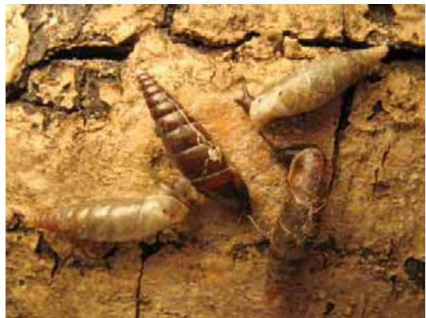
Remarquer la variation de la couleur de la coquille, qui n'est donc pas un critère suffisant pour l'identification.