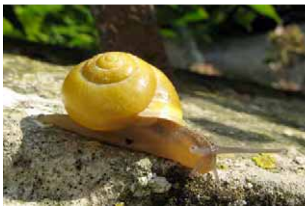
Les bandes peuvent être absentes...