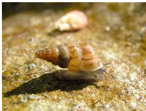
Le cochlostome commun Cochlostoma semptemspirale est le plus répandu des cochlostomes en France. Il vit plutôt dans les endroits humides sur le sol, par exemple sous les pierres ou le bois mort.