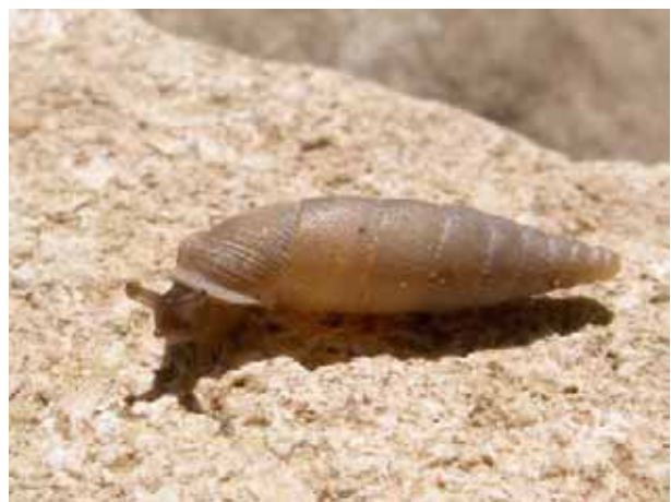
D'autres favorisent les rochers ou les vieux murs (ici la perlée des murailles Papillifera solida )