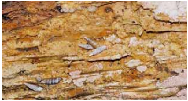
Certaines espèces se rencontrent en nombre sur le bois mort.