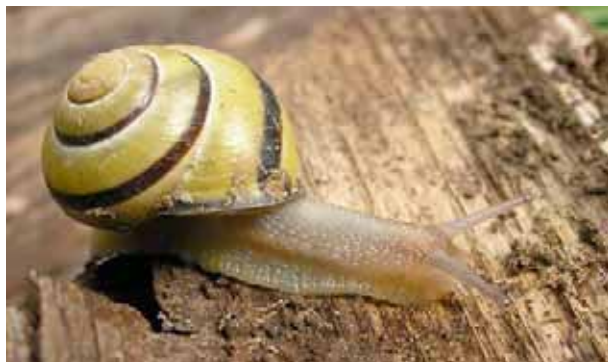
Escargot des haies typique

Ces trois espèces présentent une grande variété de coloration des coquilles, même au sein d'une seule population : tous les individus de la photo de droite ont été collectés sur quelques dizaines de mètres carrés.