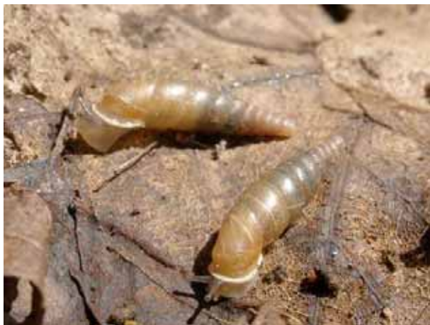
On distingue par transparence les lamelles internes de la coquille.