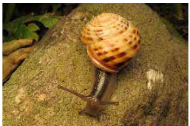
... ou interrompues (escargot des forêts).