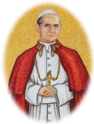
Saint Paul VI, pape Angélus, 25 mars 1975

Ô Marie, nous tournons vers toi notre regard et nous te rendons grâce, car c'est précisément dans ta réponse humble et courageuse : « Voici la servante du Seigneur ; qu'il me soit fait selon ta parole » , que tu as permis à Dieu de se faire homme. Donne-nous aussi, ô Marie, de répondre chaque jour à l'appel du Seigneur par un « Oui » humble et fort, afin que notre pauvre vie puisse devenir, par la puissance de ton Fils et par l'action de l'Esprit Saint, un lieu où Dieu demeure et un instrument pour le salut de tous. . Amen