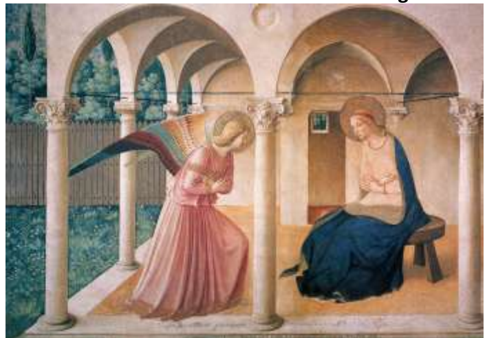
L'Annonciation de Fra Angelico