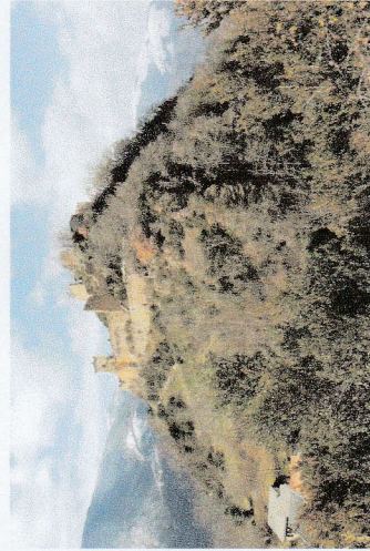
Château de Lordat

L'altitude du territoire varie entre 552 m et 1485 m.