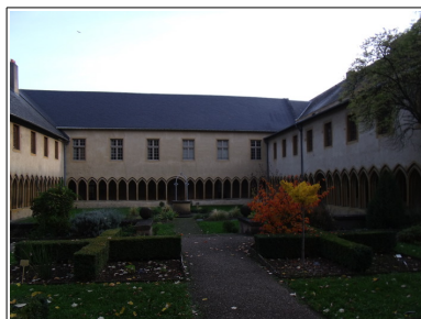
Cloître des Récollets