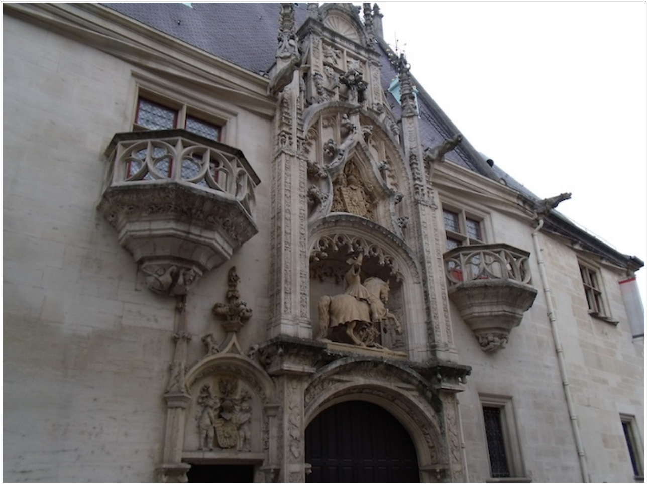
Palais des Ducs de Lorraine

Le mercredi 21 fut une journée dédiée à l'Art Nouveau avec le matin la visite guidée de la Villa Majorelle qui a ouvert ses portes début 2020 après rénovation. Cette villa construite pour Louis Majorelle,ébéniste et décorateur, un des piliers de l'Ecole de Nancy. Ce fut la première villa de Nancy entièrement de style Art Nouveau. On y trouve tous les éléments de ce mouvement et les principaux artistes de l'Ecole de Nancy ont contribué à sa réalisation.