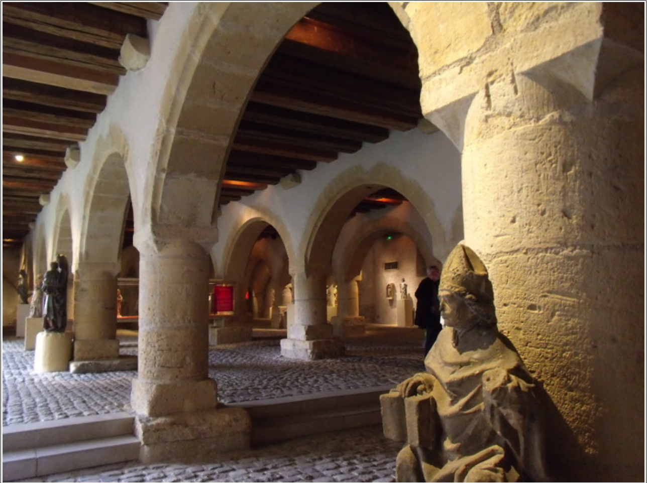
Musée de la Cour d'Or

L'après-midi fut consacré au Musée de la Cour d'Or très riche en collections de l'Antiquité et du Haut Moyen-âge. Malheureusement certaines salles étaient fermées pour des raisons sanitaires. La fin de la journée a permis d'avoir un temps libre dans Metz.