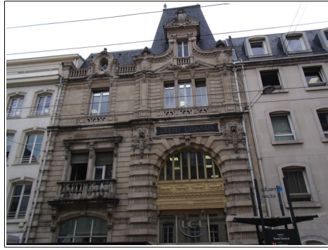
Façade de la banque LCL