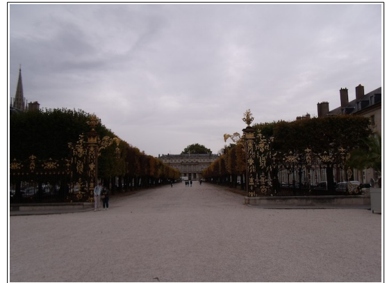
Place de la Carrière