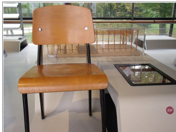
Un exemple bien connu du travail de Jean Prouvé

La matinée du jeudi 22 nous a conduits dans la banlieue de Nancy à Jarville-la-Malgrange pour une visite guidée du Musée de l'Histoire du Fer principalement axée sur « L'espace Jean Prouvé ». Jean Prouvé (1901-1984), fils de Victor Prouvé, fut architecte et designer. Ensuite nous pûmes visiter l'ensemble des collections du musée.