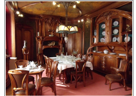
Salle à manger

Après cette visite, le temps libre permettait de visiter le jardin botanique Jean-Marie Pelt ou de découvrir d'autres aspects de Nancy.