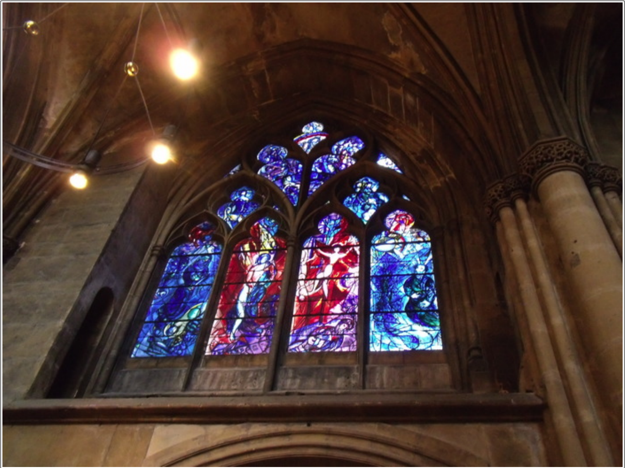
Cathédrale Saint-Etienne vitrail de Marc Chagall