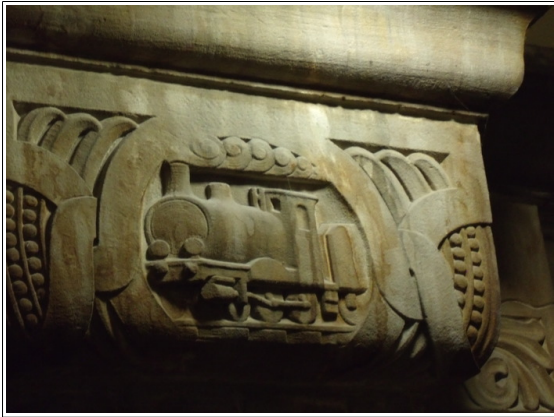
Un élément décoratif de la gare de Metz