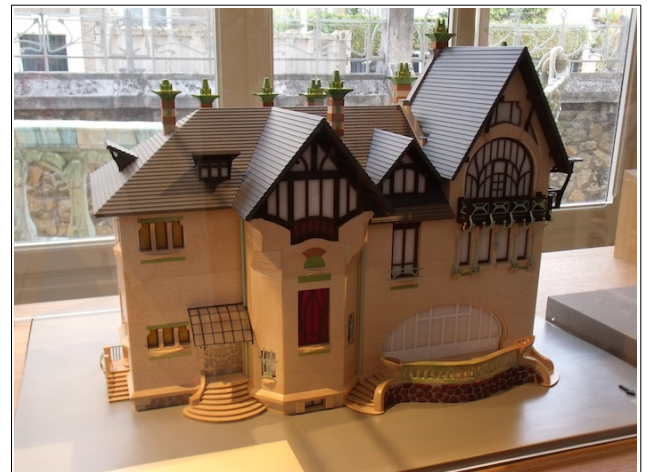
Maquette de la Villa Majorelle