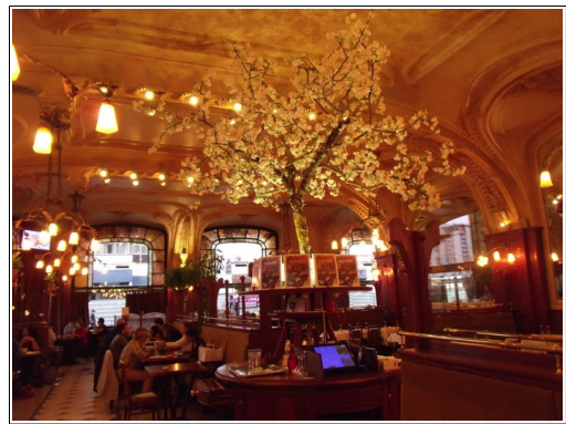
Intérieur de la brasserie L'Excelsior

Le vendredi 23 avant de nous séparer nous nous sommes retrouvés au Musée des Beaux Arts pour voir la collection Daum qui a été installée dans le sous-sol du musée, là où lors de fouilles archéologiques fut découvert le bastion d'Haussonville des XV e et XVI e siècles, un superbe cadre. La visite guidée comme toutes les précédentes fut remarquable tant par la qualité et la précision des explications que par la richesse de la collection. Outre les différents vases, verres (cf. diaporama) nous avons pu admirer une magnifique tapisserie de Jean Lurçat :