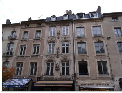
Rue des Dominicains