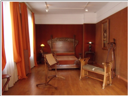
Mobilier d'une chambre

L'après-midi ce fut le Musée de l'Ecole de Nancy, situé dans la maison d'Eugène Corbin, qui nous a accueillis avec une visite guidée qui nous fit découvrir toutes les formes d'art de cette école: meubles, vitraux, verreries, peintures, céramiques, tissus. Les maîtres de l'Ecole de Nancy étaient outre Louis Majorelle et Eugène Corbin : Emile Gallé, Eugène Vallin, Victor Prouvé, les frères Auguste et Antonin Daum, Camille Martin, Louis Hestaux, Jacques Gruber.