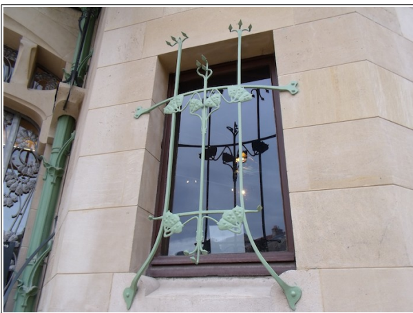
Elément de décoration de la Villa

Le mercredi 21 fut une journée dédiée à l'Art Nouveau avec le matin la visite guidée de la Villa Majorelle qui a ouvert ses portes début 2020 après rénovation. Cette villa construite pour Louis Majorelle,ébéniste et décorateur, un des piliers de l'Ecole de Nancy. Ce fut la première villa de Nancy entièrement de style Art Nouveau. On y trouve tous les éléments de ce mouvement et les principaux artistes de l'Ecole de Nancy ont contribué à sa réalisation.