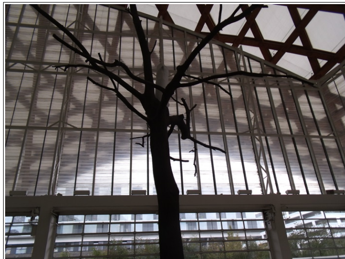
Intérieur du Centre Pompidou de Metz

Notre voyage a commencé le dimanche 18 octobre par la visite guidée du Centre Pompidou à Metz. L'accent a été mis sur l'architecture du bâtiment et sur l'exposition consacrée à Yves Klein. Ensuite nous avons pu à notre guise découvrir le bâtiment et les autres lieux d'exposition.