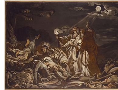
Jean-Baptiste Deshayes, Achille pleurant la mort de Patrocle

Hélène Dumas Sans Ciel ni Terre. Paroles orphelines du génocide des Tutsi (1994-2006) , Février 2021 – 7 décembre 2020 - 19h00