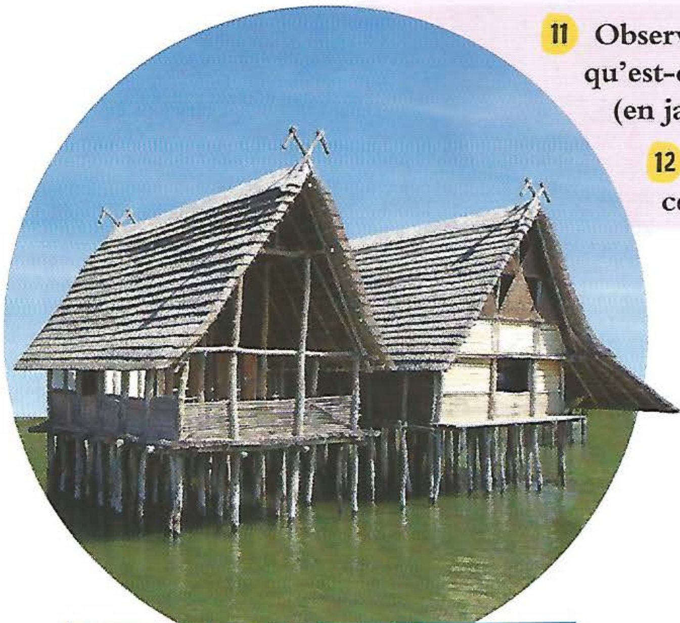
Reconstitution de maisons d'il y a 3000 ans