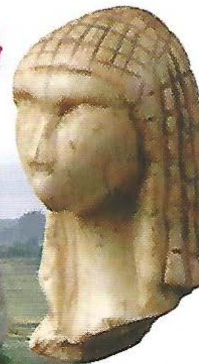
Statuette vieille de 25 000 ans

À Carnac, on a trouvé 3 000 pierres alignées datant de la préhistoire.