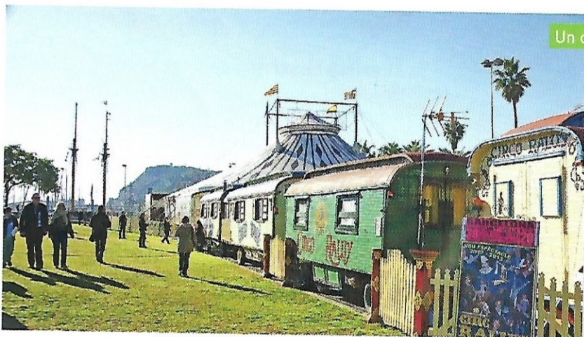
Un cirque itinérant (Europe)