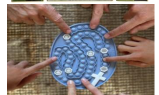
Prier le chapelet en famille avec le OuiPop de Maison Capelia