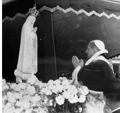
Paul VI au Sanctuaire de Fátima en 1967

Nous adjurons donc tous les responsables des affaires publiques de ne pas rester sourds à l'aspiration unanime de l'humanité, qui veut la paix. Qu'ils fassent tout ce qui dépend d'eux pour sauver la paix menacée. Qu'ils continuent de promouvoir et de favoriser les conversations et les négociations à tous les niveaux et en tout moment, afin d'arrêter le périlleux recours à la force avec toutes ses déplorables conséquences matérielles, spirituelles et morales. Qu'ils s'efforcent, en suivant les voies tracées par le droit, de rencontrer tout désir sincère et véritable de justice et de paix, afin de l'encourager et de le faire aboutir. Qu'ils aient confiance dans toute manifestation authentique de bonne volonté, de façon à faire prévaloir la cause positive de l'ordre sur celle du désordre et de la ruine.