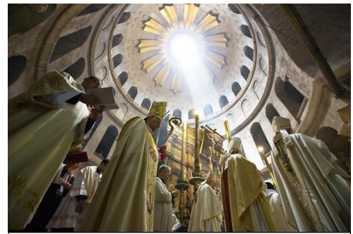
Célébration en la Basilique du St Sépulcre