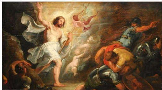
Pierre Paul Rubens - Résurrection du Christ

(Article du Père Jean de Massia publié sur le site Claves)