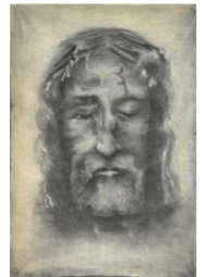
Ste Face peinte par la Sœur de Ste Thérèse de Lisieux (Sr Geneviève) →