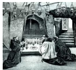
À l'autel des Mages