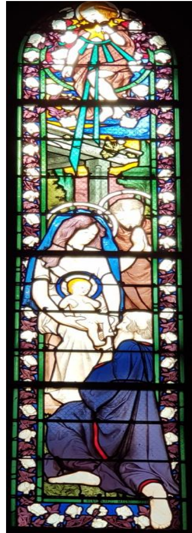
Vitrail dans le Chœur de notre église