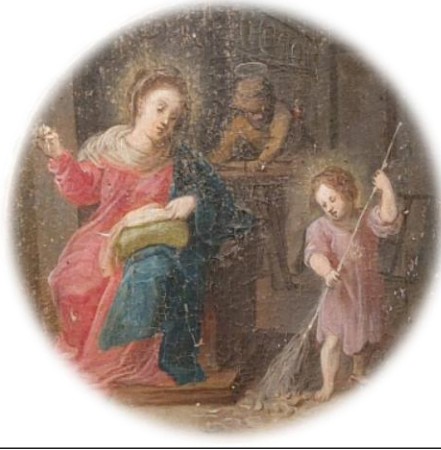
Pendant que St Joseph travaille à l'atelier, et Notre Dame fait de la couture, Jésus rend service en balayant ☺