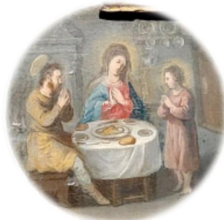
Le « Benedicite » avant de manger !