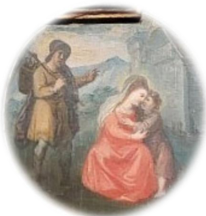
Une pause lors d'une promenade !

Saint Jean Paul II dans sa lettre apostolique sur le Rosaire : « De nombreux problèmes des familles contemporaines, particulièrement dans les sociétés économiquement évoluées, dépendent du fait qu'il devient toujours plus difficile de communiquer. On ne parvient pas à rester ensemble, et les rares moments passés en commun sont absorbés par les images de la télévision. Recommencer à réciter le Rosaire en famille signifie introduire dans la vie quotidienne des images bien différentes, celles du mystère qui sauve : l'image du Rédempteur, l'image de sa Mère très sainte. La famille qui récite le Rosaire reproduit un peu le climat de la maison de Nazareth : on place Jésus au centre, on partage avec lui les joies et les souffrances, on remet entre ses mains les besoins et les projets, on reçoit de lui espérance et force pour le chemin »