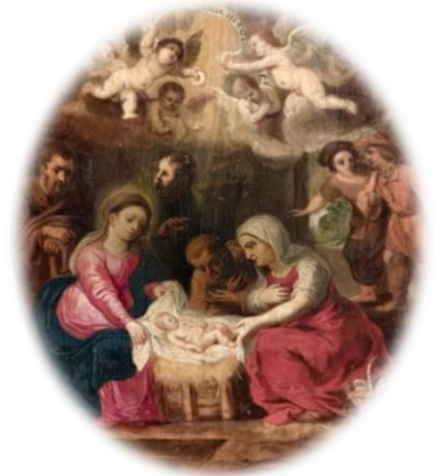
Nativité. Détail retable XVII ème . Église de Bougival

Extrait de l'hymne de l'office des lectures pour Noël