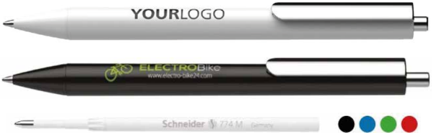
Recharge / Refill 774M

Stylo bille en plastique recyclé post consommation à 90%, de manufacture Européenne dont la fabrication et le transport jusqu'à chez vous sont compensés carbone.