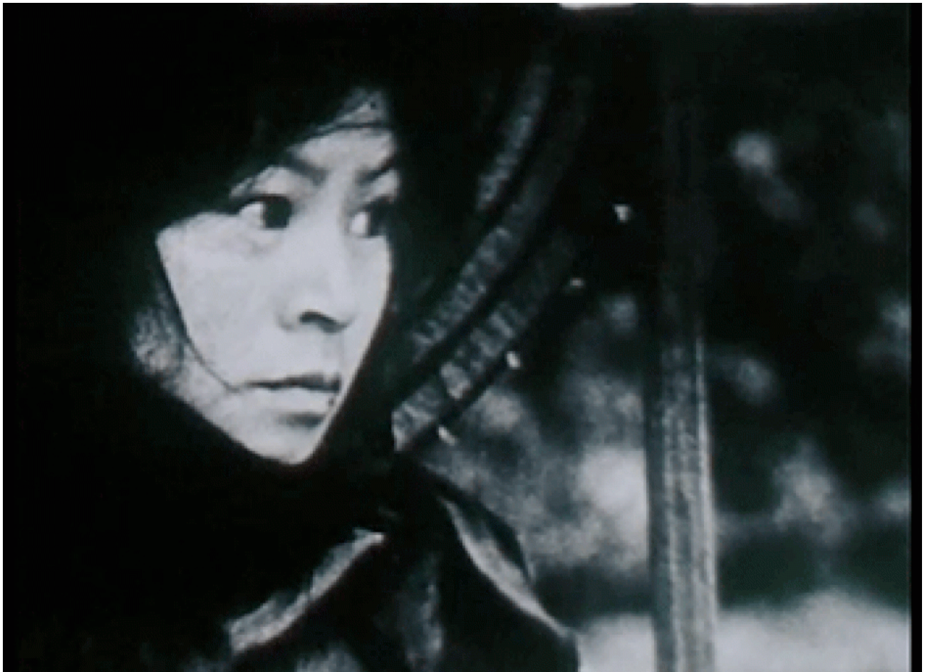
Le Traîneau échelle, Jean-Pierre Thiébaud