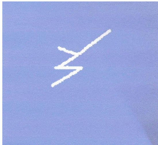
Symbole du Reiki Snap of the Dragon

Pour apprivoiser un Dragon servez-vous du symbole suivant ainsi que pour vous connecter à lui.