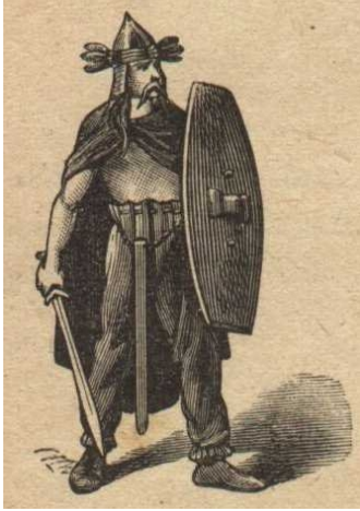
Un guerrier gaulois

Au sud de la Gaule, en Italie, une puissante civilisation s'étend depuis le VII (7ème) siècle avant Jésus-Christ. Rome , fondée en 753 avant J-C, est devenue la capitale d'un vaste empire dont les frontières atteignent le territoire des Gaulois.