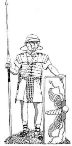
Un légionnaire romain

L'armée romaine n'est pas mieux équipée que les Gaulois, mais elle est très bien organisée, contrairement aux Gaulois qui attaquent en ordre dispersé. Les légions romaines parviennent ainsi à vaincre des armées beaucoup plus nombreuses.