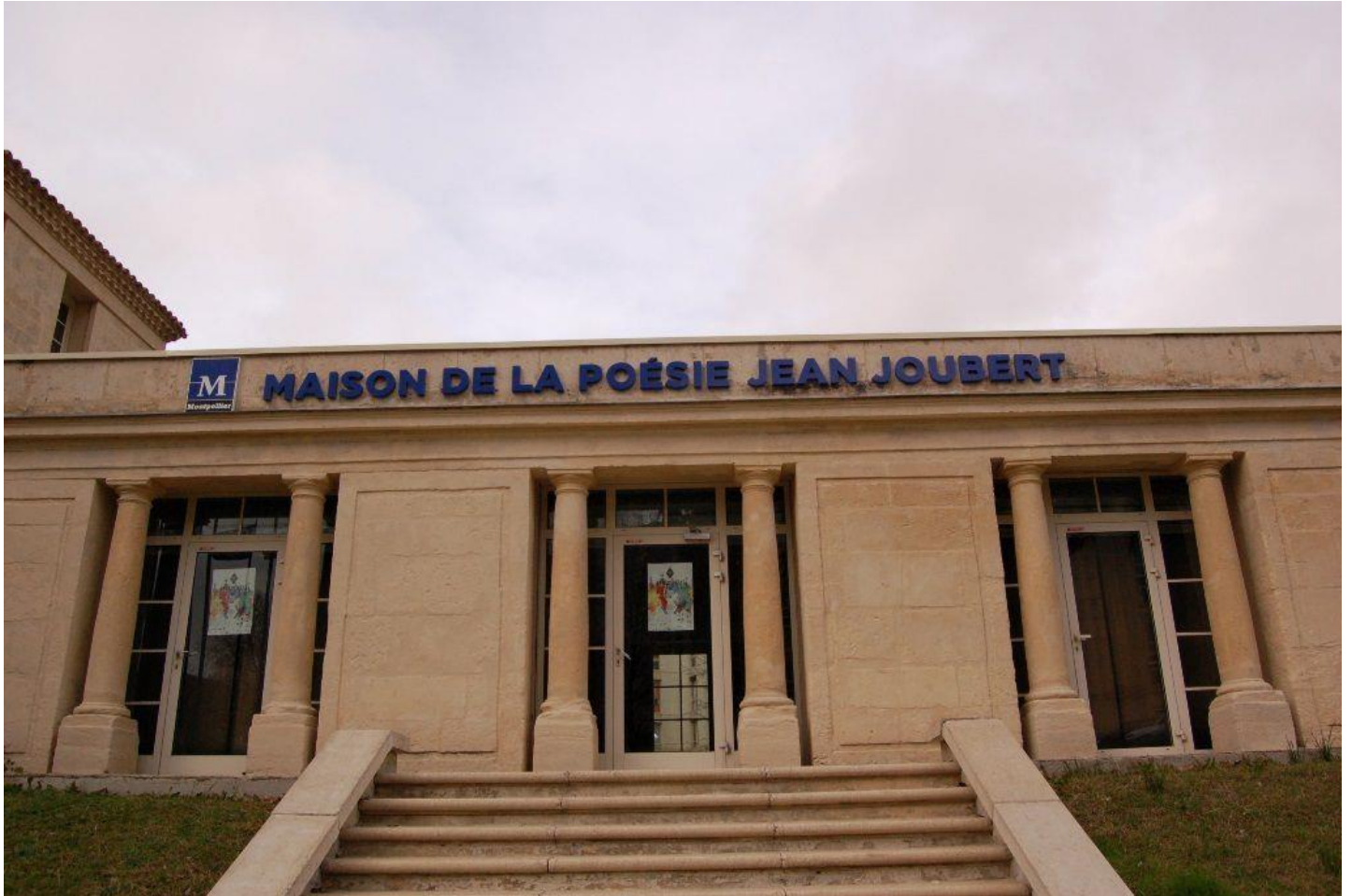
MAISON de la POESIE JEAN JOUBERT