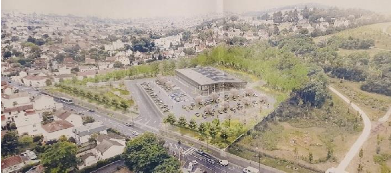
La Butte d'Orgemont, défigurée par le Lidl (projet).

Il existe déjà trois LIDL dans un rayon de trois kilomètres à Sannois, Saint Gratien et Epinay (juste derrière Joliot-Curie) ! Combien d'emplois seront créés pour les Argenteuillais mais surtout combien seront détruits ?