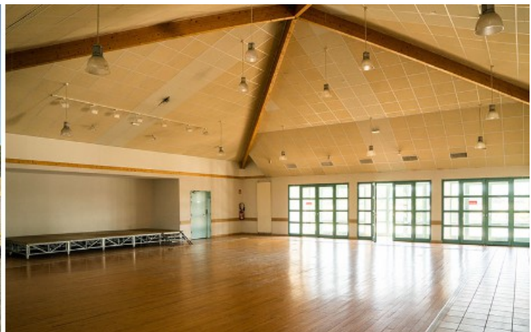
Salle des fêtes d' Ox - Chemin de Marragon – Muret 31600