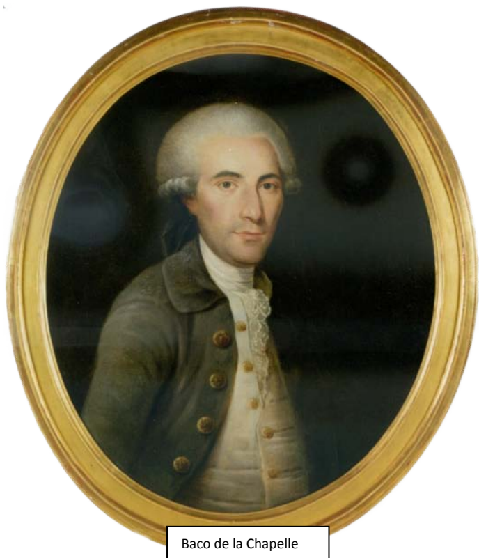
Baco de la Chapelle

18 juillet 1793 Coustard de Massy est décrété d'accusation pour collusion avec les Girondins membres du Directoire Départemental.