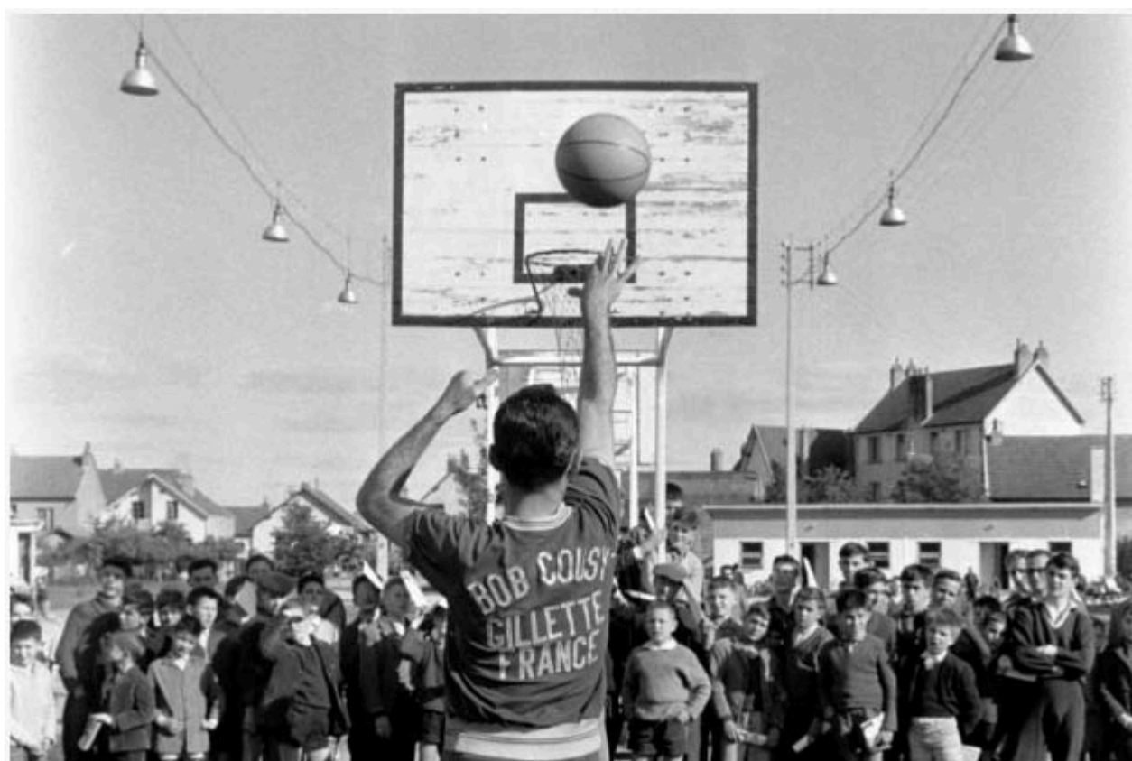
Cousy et ses cinq titres NBA face aux élèves d'une école française, en 1962.

Au printemps 1962 un basketteur star de Boston « Bob Cousy » vient faire une démonstration pour les joueurs de l'Hermine.