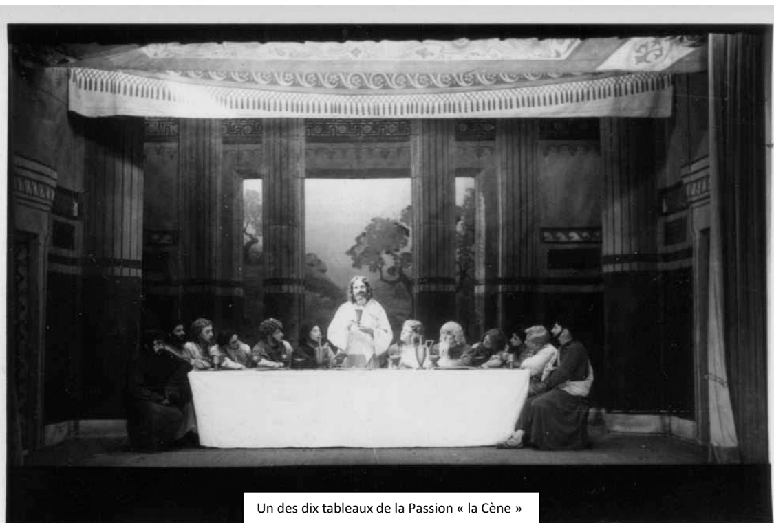
Un des dix tableaux de la Passion « la Cène »

La « Passion » comme on disait à Sainte Anne, repart en 1945 .