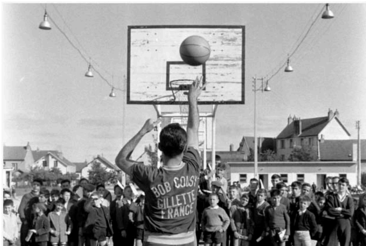
Cousy et ses cinq titres NBA face aux élèves d'une école française, en 1962.

Au printemps 1962 un basketteur star de Boston « Bob Cousy » vient faire une démonstration pour les joueurs de l'Hermine.