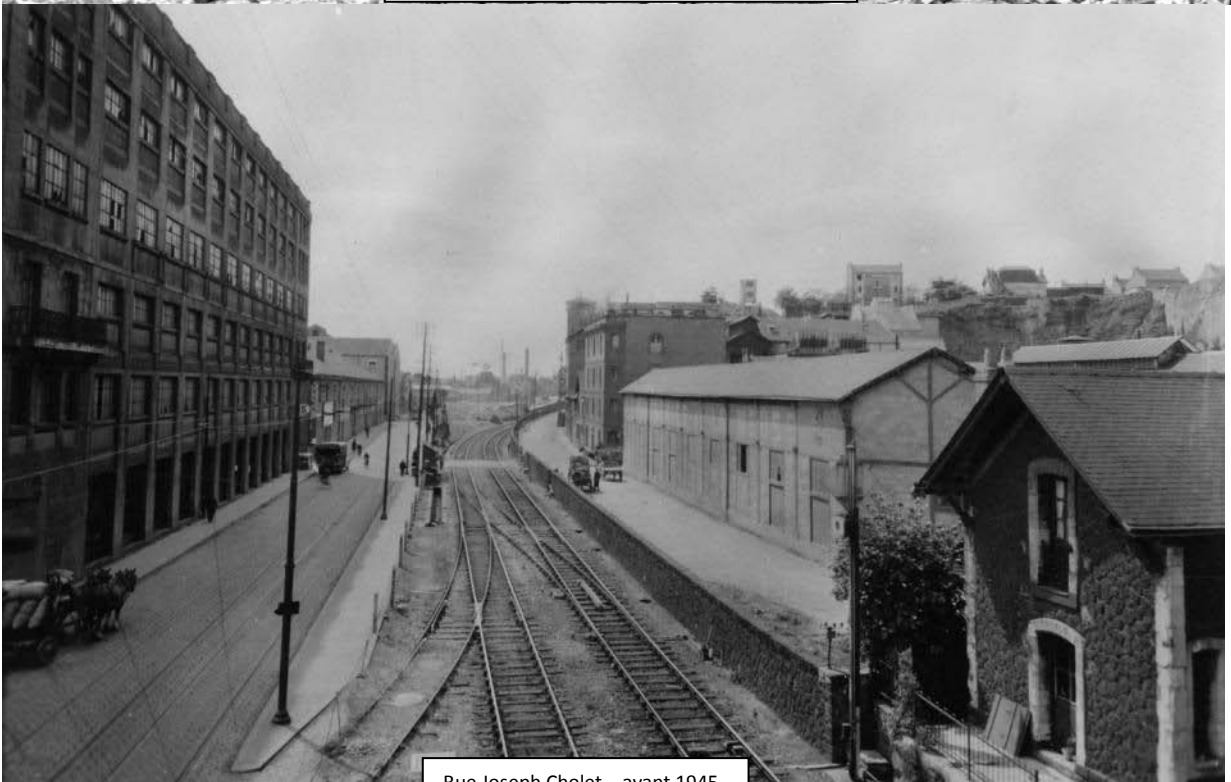
Rue Joseph Cholet – avant 1945