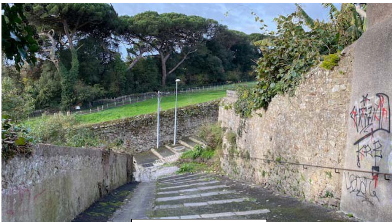
Vue sur le parc des Oblates – l'allée des soupirs

Coupé en deux sections, il est séparé par une clôture, puis renommé actuellement dans sa partie basse par une prolongation de la rue Joseph Cholet. Il présente une déclivité exceptionnelle de 15 cm par mètre.