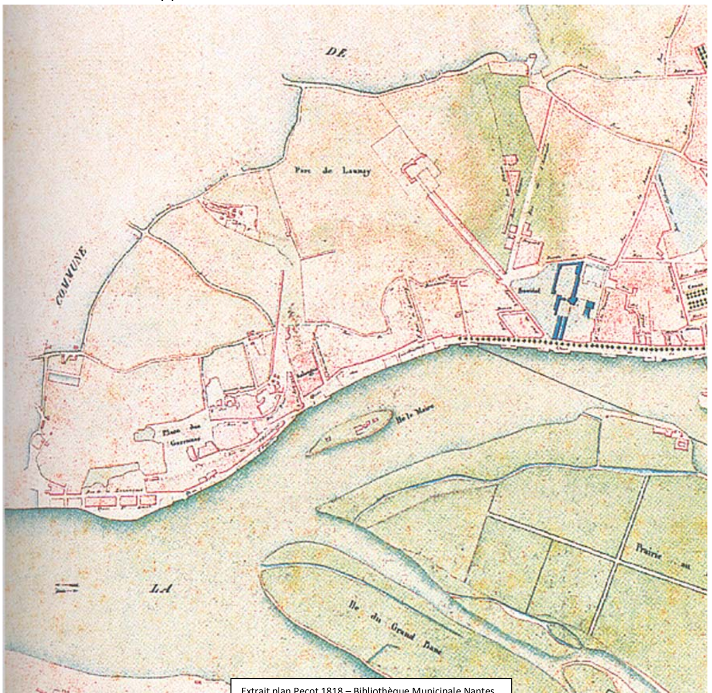
Extrait plan Pecot 1818 – Bibliothèque Municipale Nantes

Jusqu'en 1790, les Baptêmes, Mariages et Décès furent enregistrés dans la paroisse Saint-Martin de Chantenay. La Révolution modifia cette organisation en créant la XVIIIème section de Nantes appelée « Brutus ».