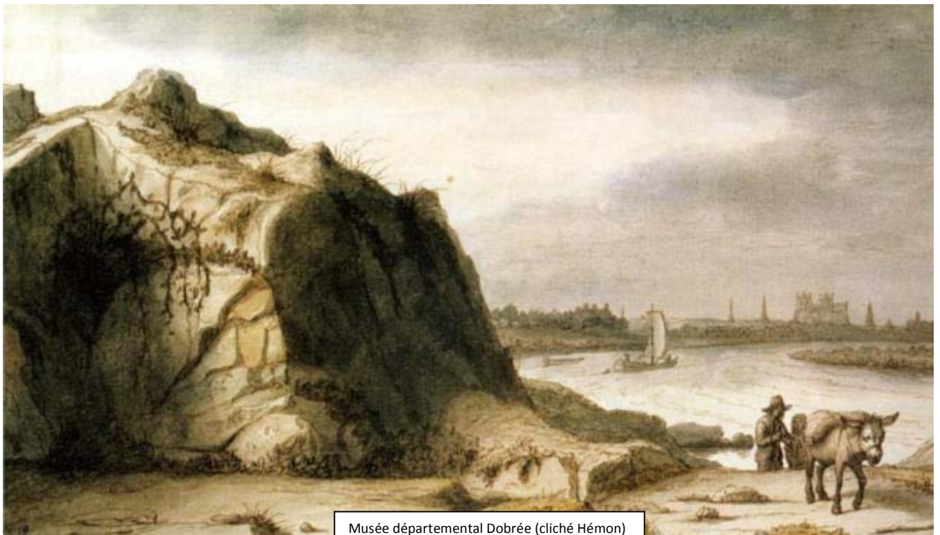
Musée départemental Dobrée

Ce point de vue panoramique sur le port, à mi-chemin de la rue de l'Hermitage, a été transformé au cours des ans. La plus ancienne représentation date de 1646.