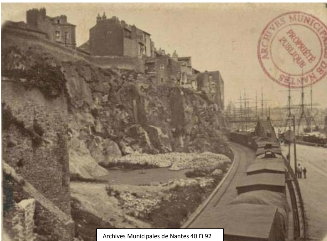
Archives Municipales de Nantes 40 Fi 92

Ce point de vue panoramique sur le port, à mi-chemin de la rue de l'Hermitage, a été transformé au cours des ans. La plus ancienne représentation date de 1646.