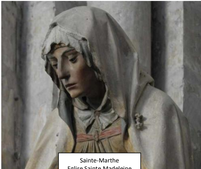
Sainte-Marthe Eglise Sainte Madeleine Troyes

Rue Sainte-Marthe commence rue Saint-Gohard finit rue Diderot