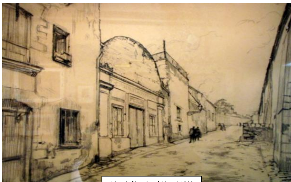
Usine Collin – René Pinard 1923

Au début du XXème siècle, l'entrepôt des Douanes y garde des denrées coloniales et autres. Ils serviront d'entrepôts à la Chambre de Commerce. Détruits pendant les bombardements, ils sont remplacés par des immeubles dans les années 1950.