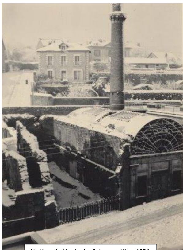
Vestiges du Musée des Salorges – Hiver 1954

La conserverie Amieux-Frères achète ces locaux pour en faire un musée de la conserverie en 1923.