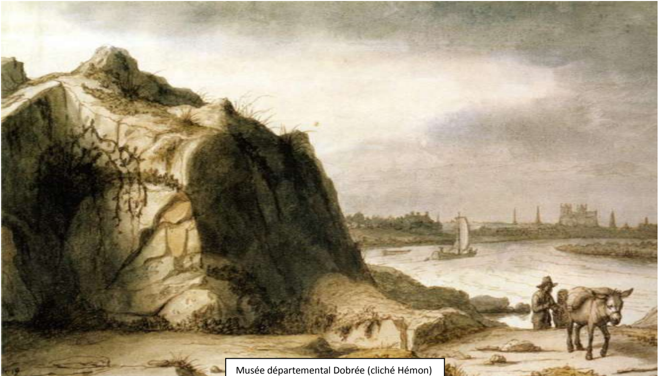
Musée départemental Dobrée (cliché Hémon)

Ce point de vue panoramique sur le port, à mi-chemin de la rue de l'Hermitage, a été transformé au cours des ans. La plus ancienne représentation date de 1646.