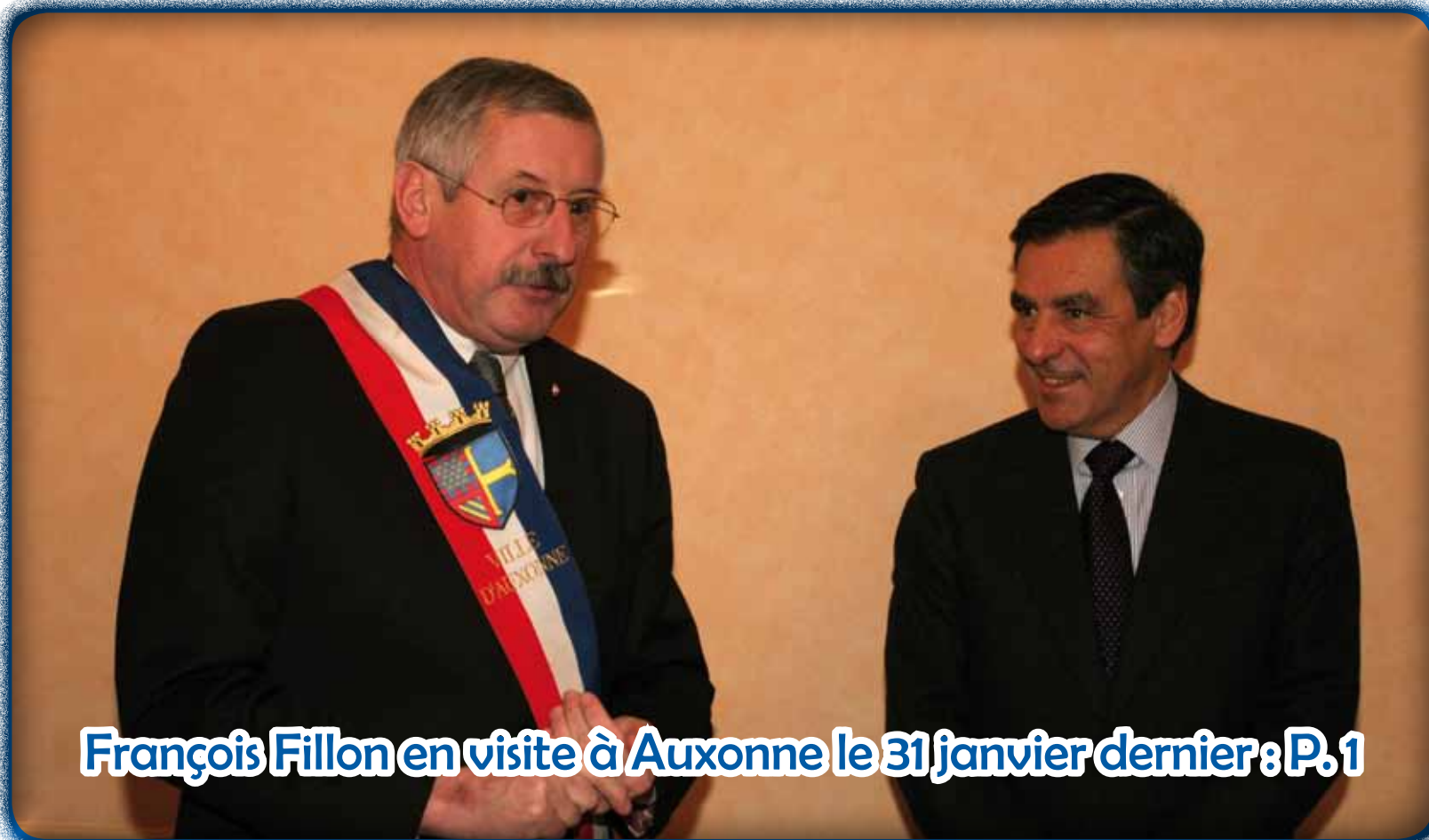
François Fillon en visite à Auxonne le 31 janvier dernier : P. 1

L'inf'Auxonne est votre magazine, le comité de rédaction appréciera vos informations, réflexions et vos photos. Le magazine est également ouvert aux associations sportives et culturelles qui souhaitent se faire connaître ou faire connaître leurs activités et le calendrier de leurs manifestations. Les informations et photos sont à fournir à la mairie.