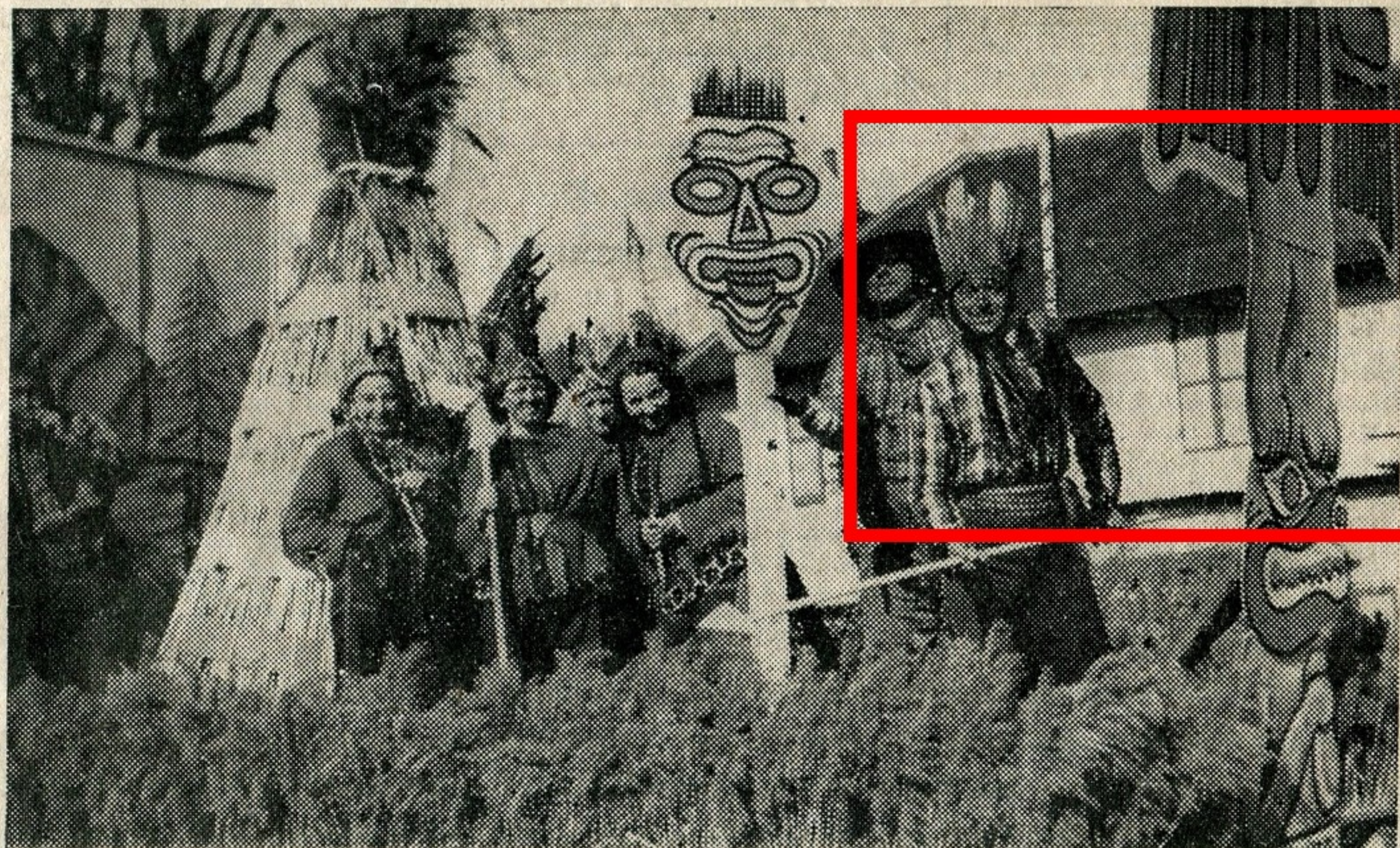
Chez les Peaux-Rouges