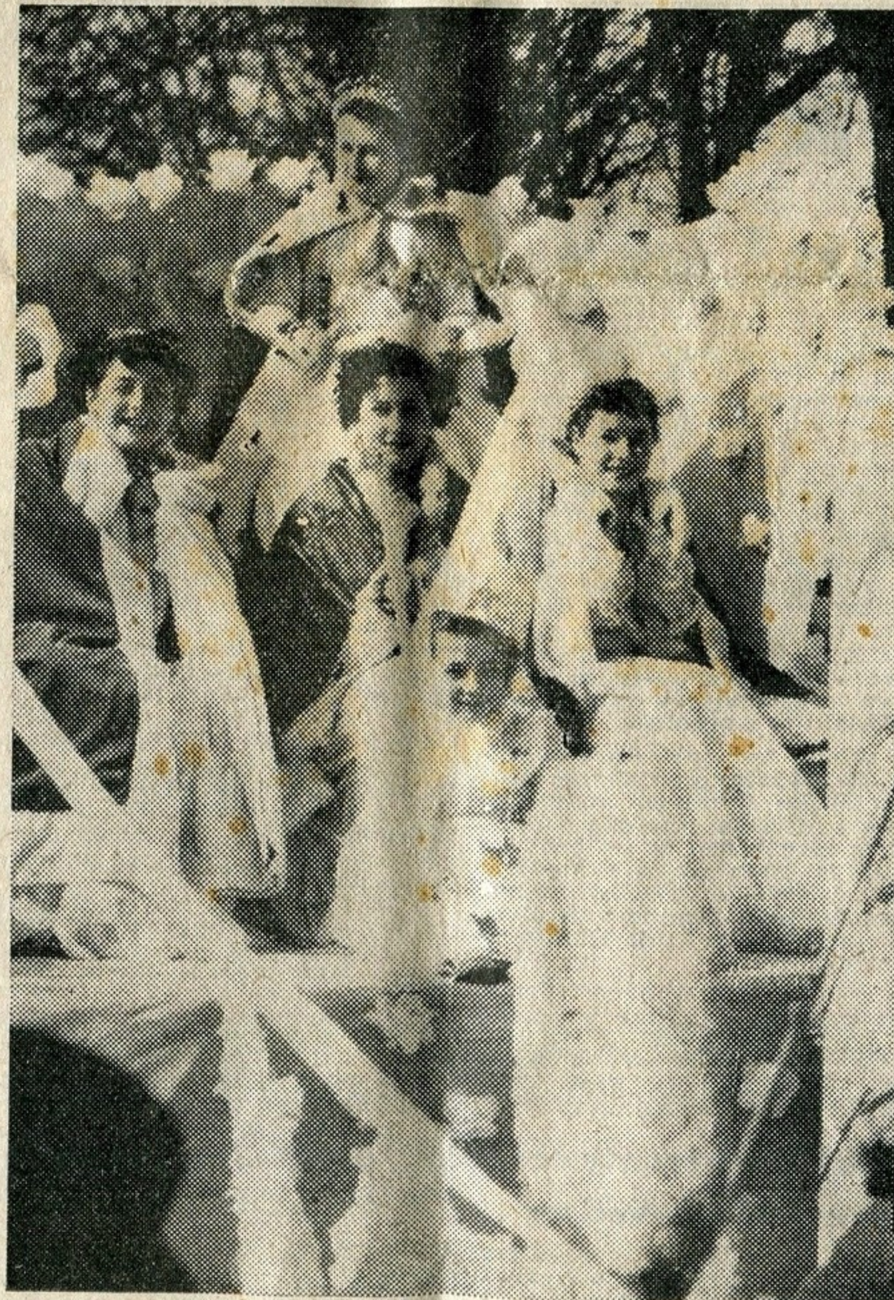
La gracieuse reine et ses demoiselles d'honneur