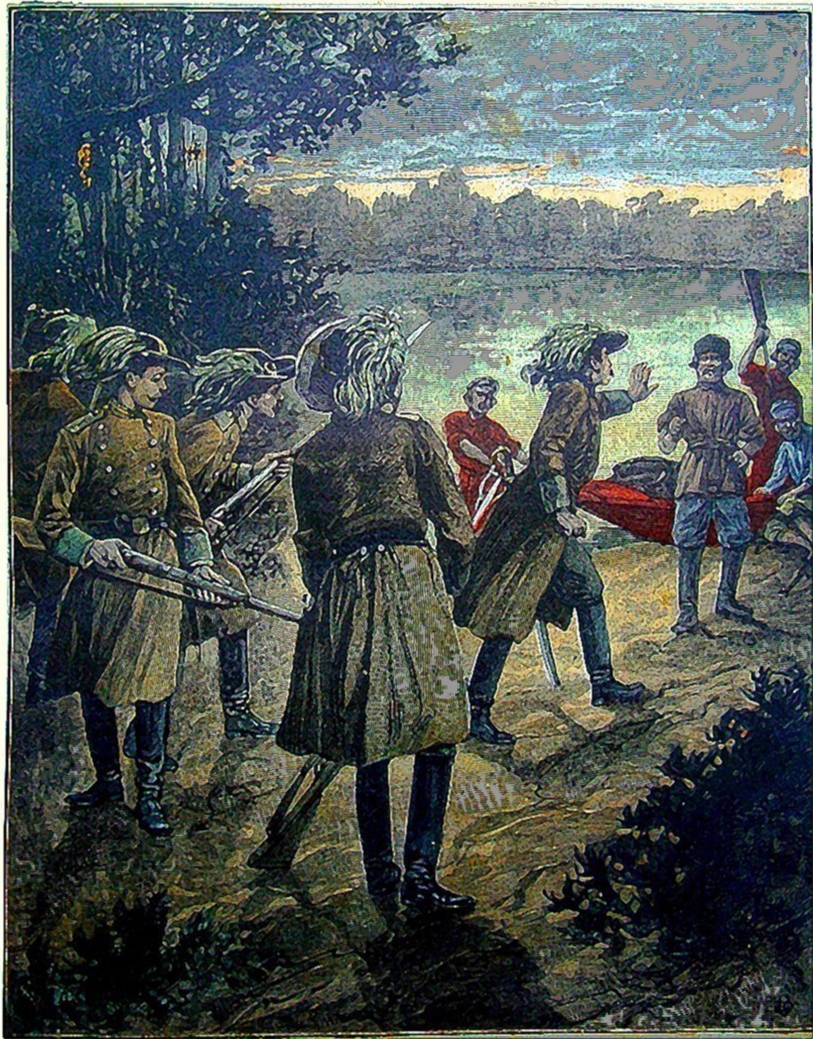
Les sentinelles établies le long des frontières de la Bulgarie pour s'opposer à l'invasion du choléra. (Voir page suivante.)

Les manuscrits non insérés ne sont pas rendus.