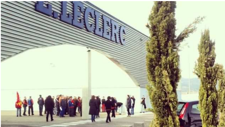
L'enseigne de la Grande Distribution est montrée du doigt par la CNIL

Par Thomas Nougailon et Christophe Tourné , France Bleu Bourgogne Vendredi 26 août 2016 à 10:42